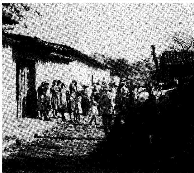
LA VIRTUD, HONDURAS

Aux termes de la législation actuelle en matière d'immigration, les groupes privés ont le droit de parrainer des réfugiés de n'importe quelle partie du monde.